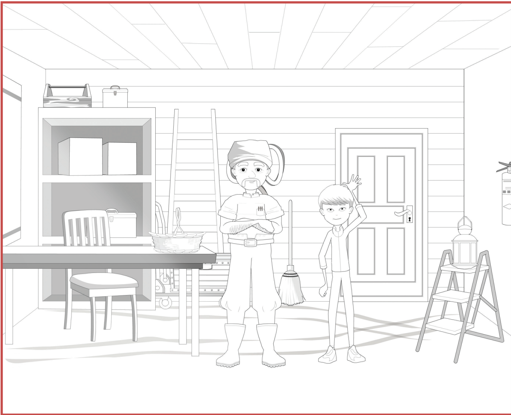
Planche à colorier