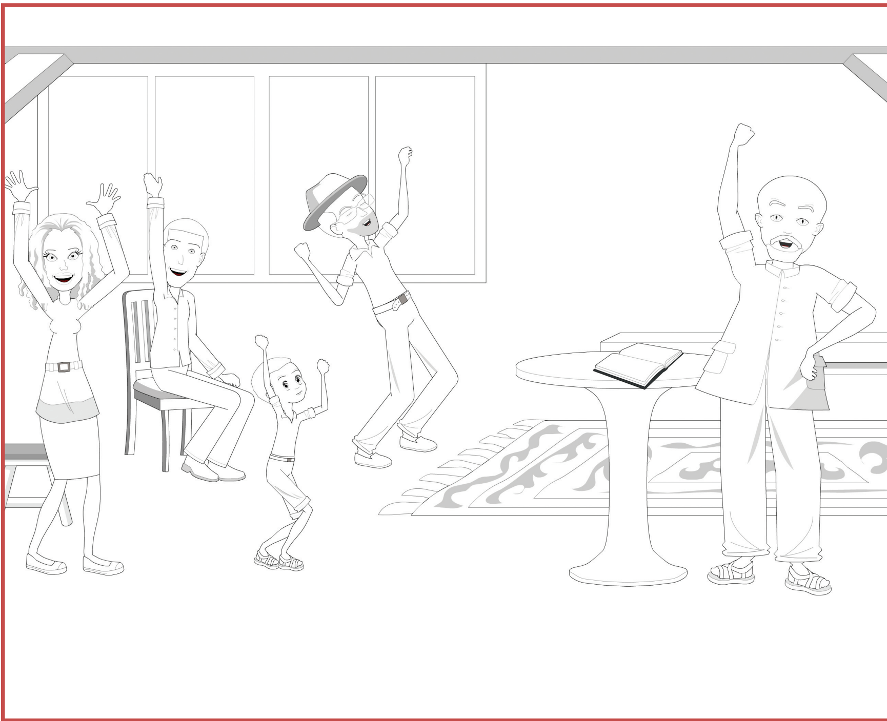
Planche à colorier