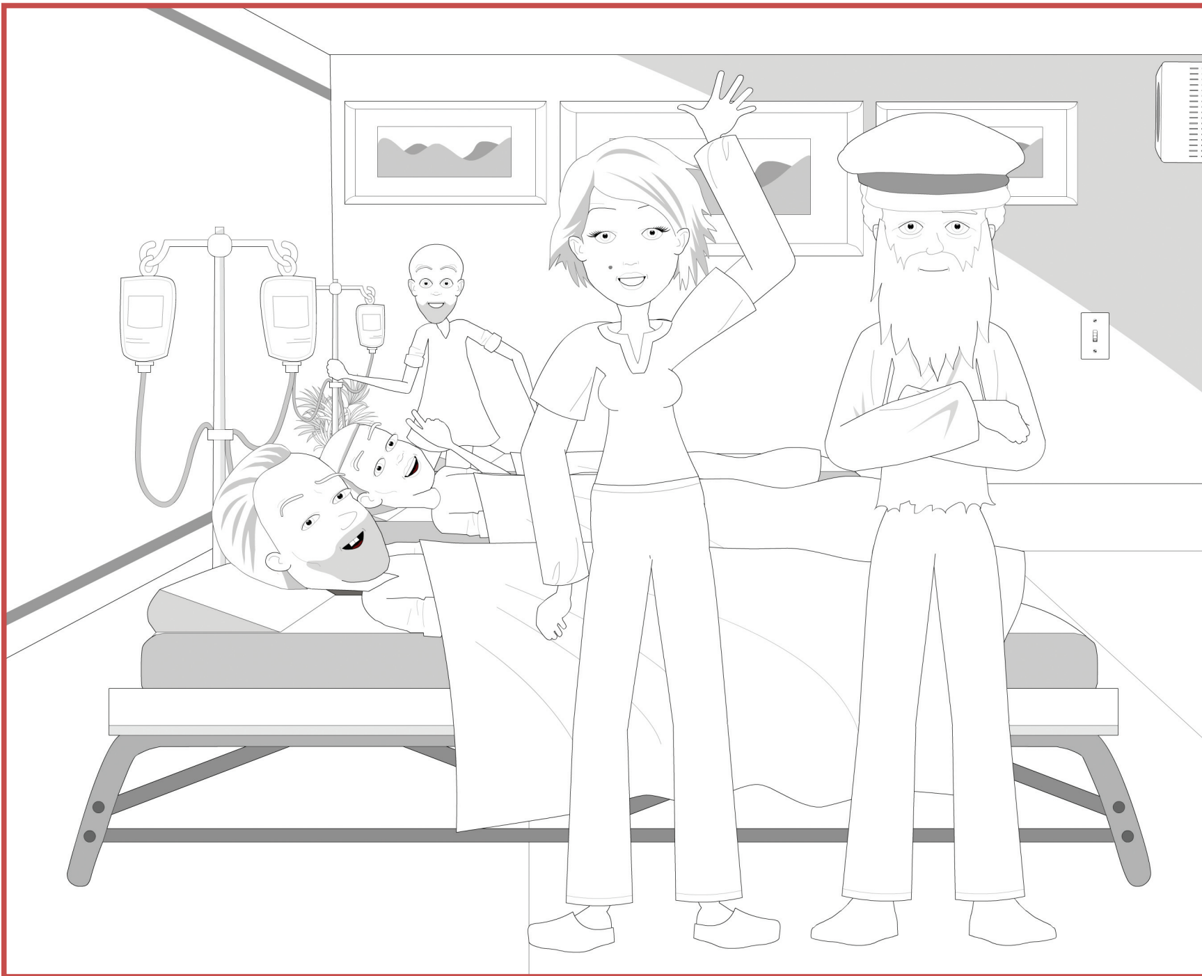
Planche à colorier